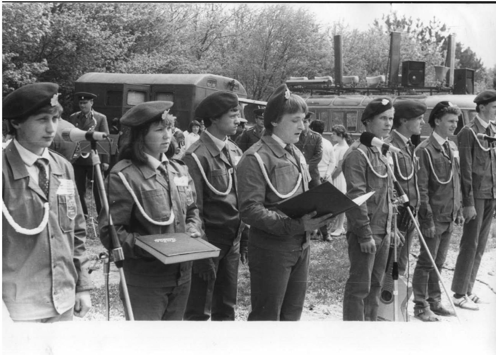
2 мая 1986 года выступление клуба «Искатель»